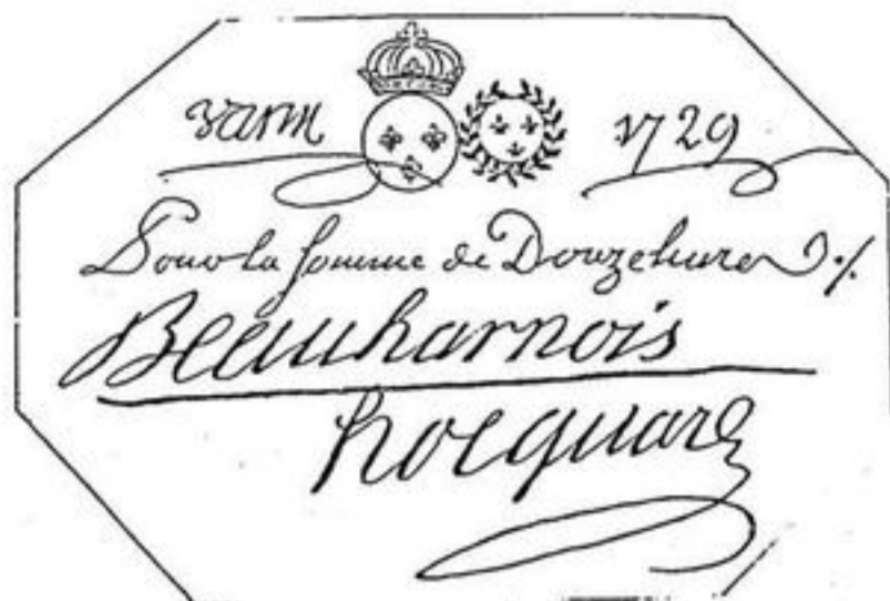
Monnaie de Carte du Canada Français