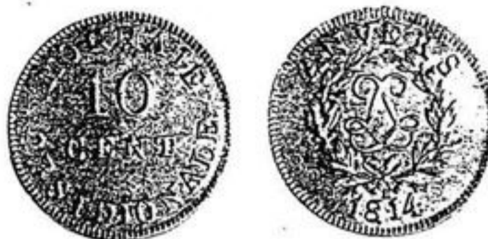
10 Centimes - Siège d'Anvers

Dans la causerie que j'ai eu le plaisir et l'honneur de vous faire, j'ai traité uniquement des espèces métalliques, c'est le thème de ma collection. Je dois toutefois rappeler que les billets émis pendant cette période furent extrêmement nombreux. Plus nombreux certainement que les jetons métalliques. Il faut aussi mentionner les très nombreuses monnaies-timbres.