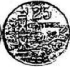
25 c nickel - PATEV