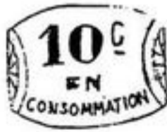
HERAULT - ZINC NICKELE