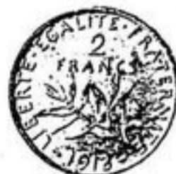
50 c, 1 Fr et 2 Frs Argent - Semeuse de Roty